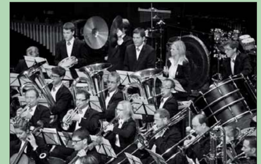
Musikverein Verena Wollerau